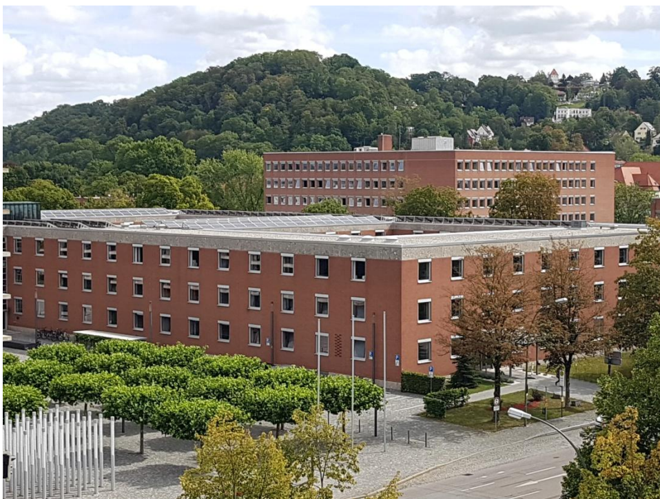
Ansicht Finanzamt Landshut